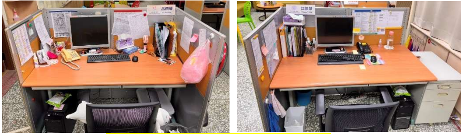
目前兩位實習諮商師的辦公位置