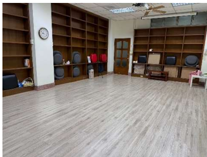
團體諮商室全面(左半邊)