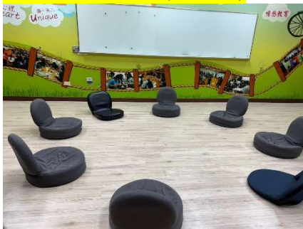
團體諮商室, 擺放團體椅後