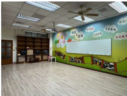
團體諮商室全面(右半邊)