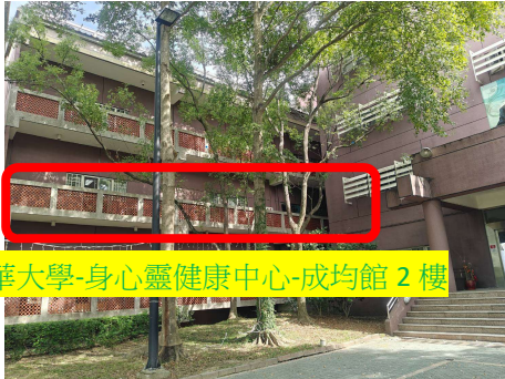
南華大學-身心靈健康中心-成均館 2 樓