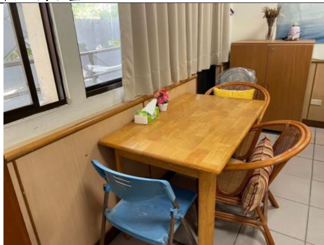
心理測驗室(由外向內)：獨立空間可供需進行測驗/評估時使用