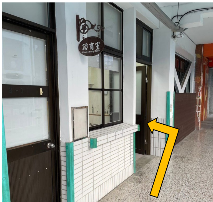
諮商室為獨立進出口的区域(入口處)