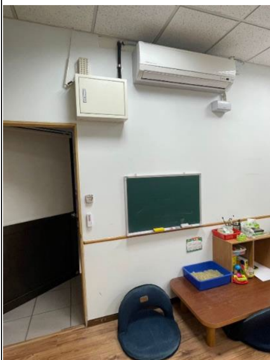
遊戲治療室(由內向外)： 舒適的木板地板讓孩子能拖鞋進行遊戲治療