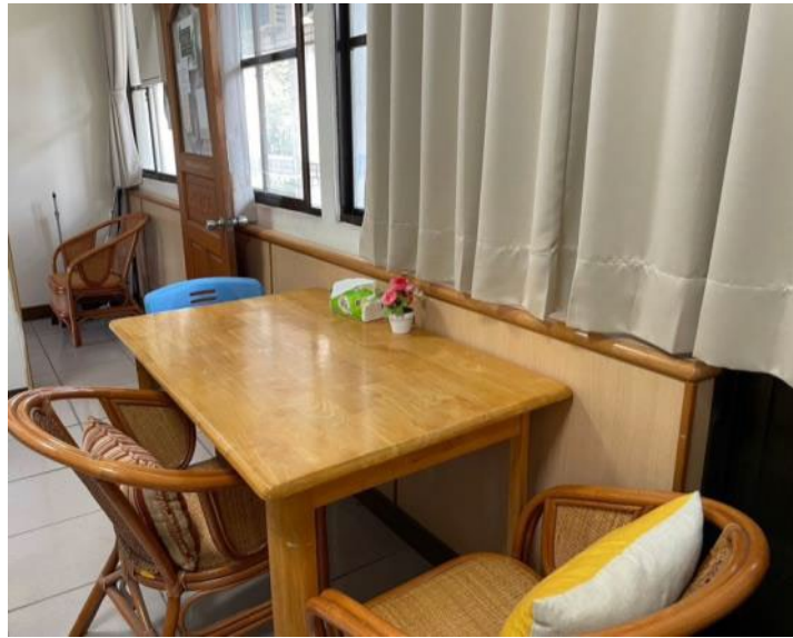
心理測驗室(由內向外)：簡潔明亮的獨立空間