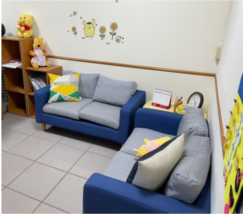
諮商室二(由外往內)：備有沙發、抱枕、玩偶、情緒臉譜，營造舒適空間