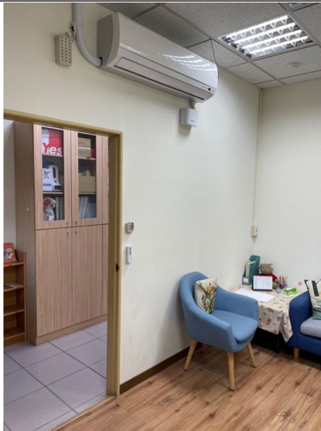
諮商室一(由內向外)：在諮商室中皆設有警鈴與緊急照明裝置