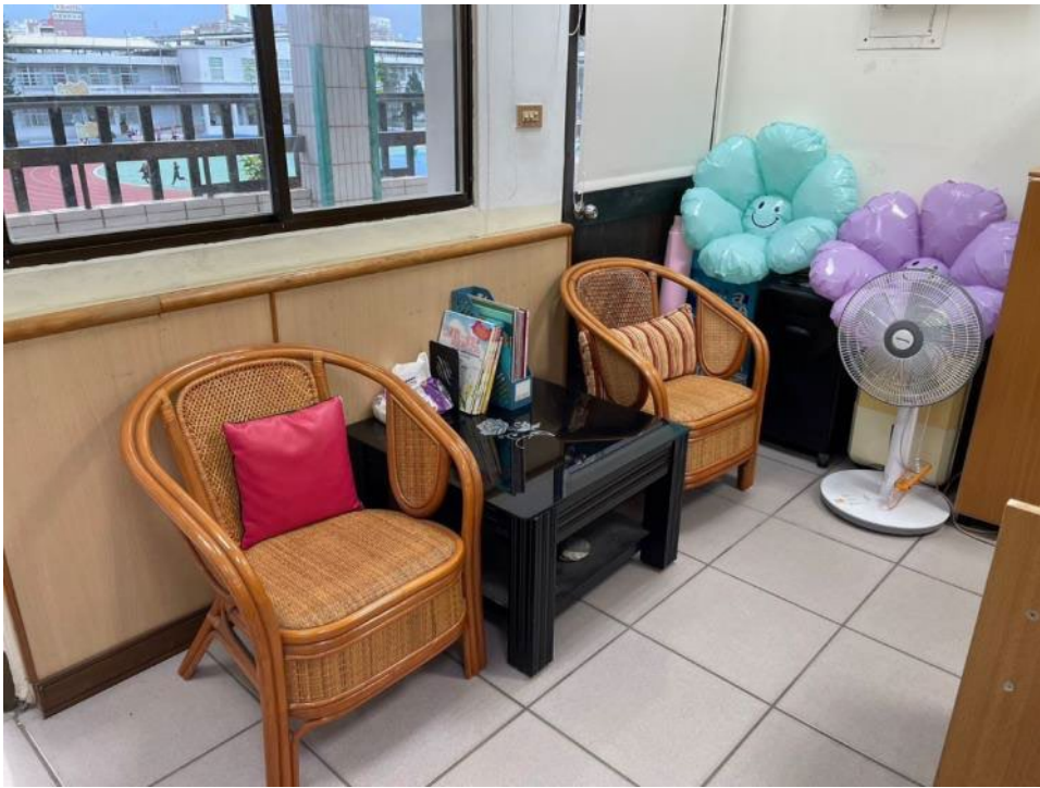
諮商室入口處設置給個案的等待區域