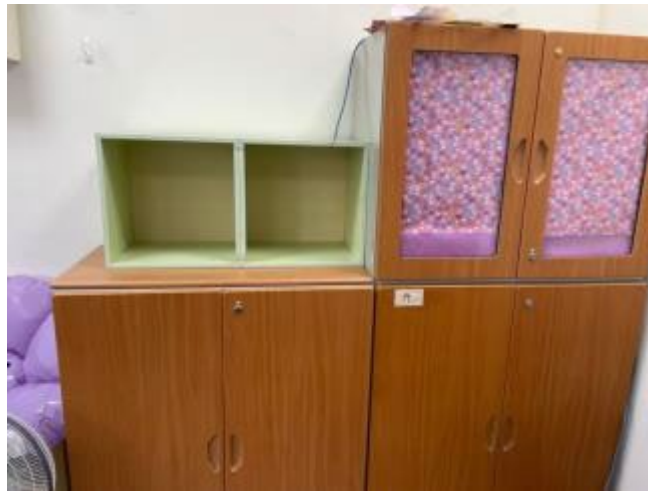
個案紀錄檔案櫃，皆為可上鎖的櫃子