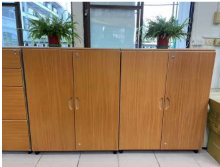
辦公室備有可上鎖的個案紀錄櫃，可存放個案紀錄或相關資料