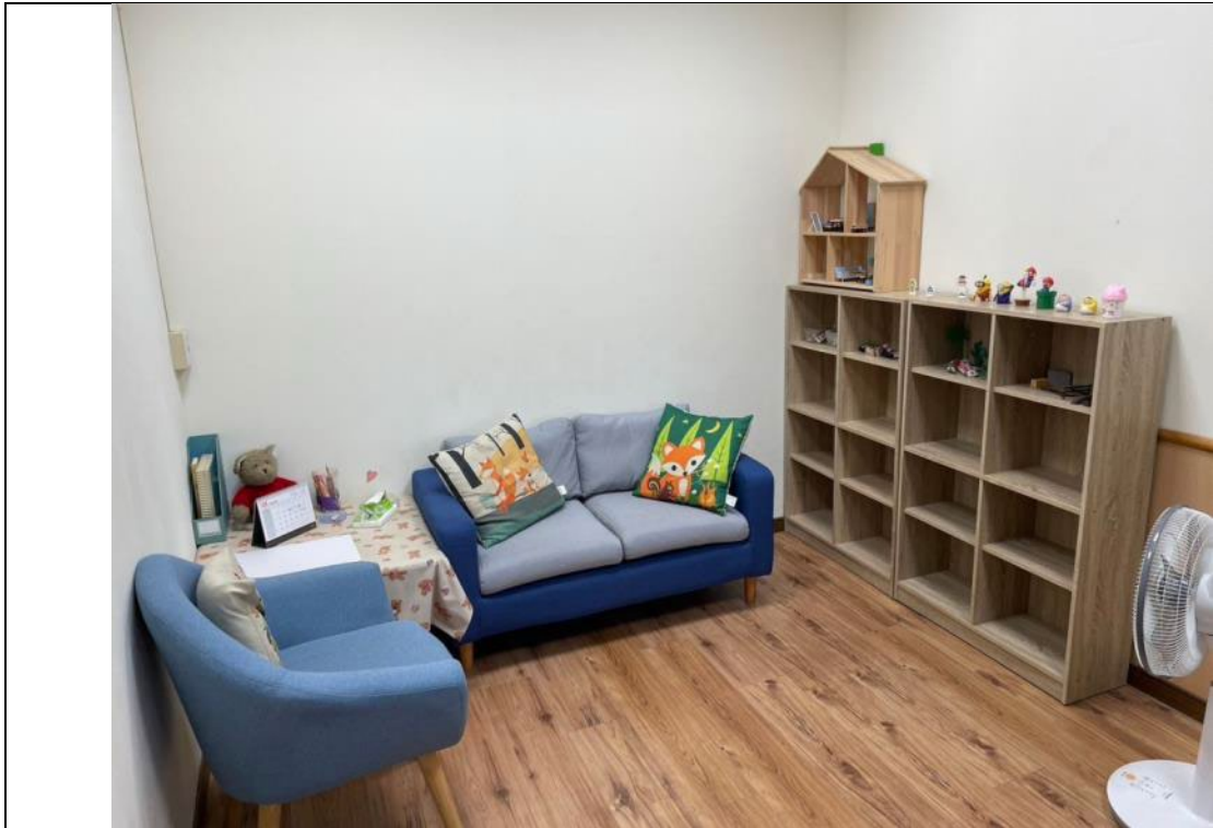
諮商室一(由外向內)：諮商室內設有沙發與木板地板，空間舒適溫馨