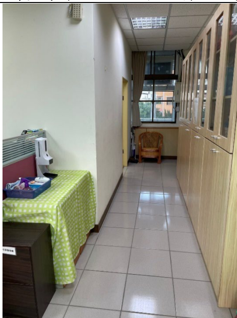
諮商室的入口處備有緊急照明燈