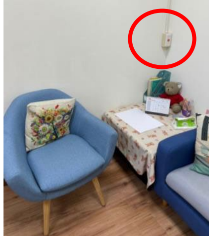
諮商空間中也皆設有警鈴設備