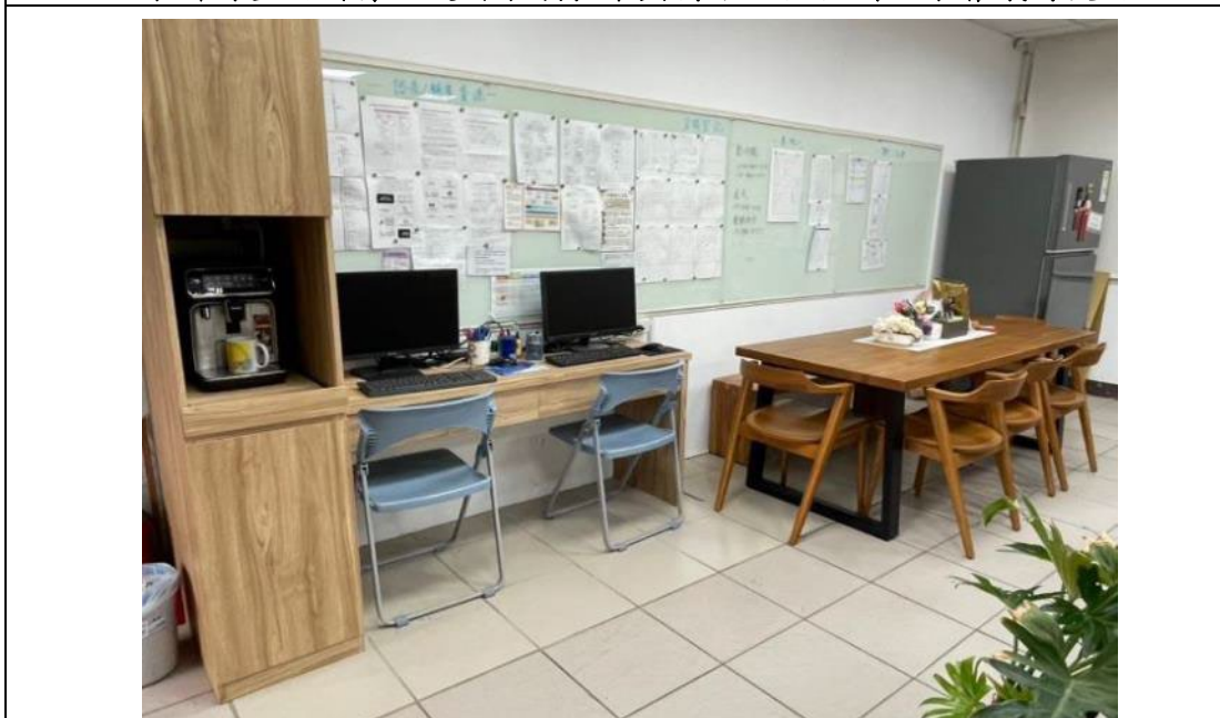
本輔導室內的會議室空間設有溫暖的木頭長桌椅及相關設備