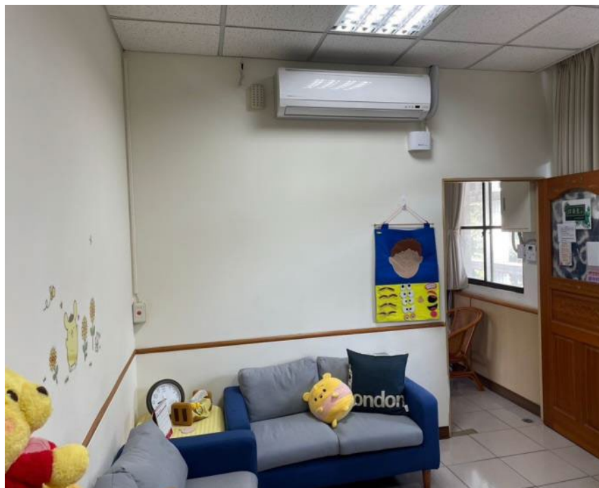
諮商室二(由內向外)：空間皆設有警鈴、緊急照明設備。