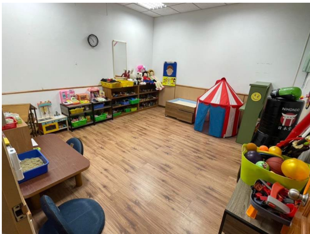
遊戲治療室(由外向內)：機構備有完善、溫馨的遊戲治療室