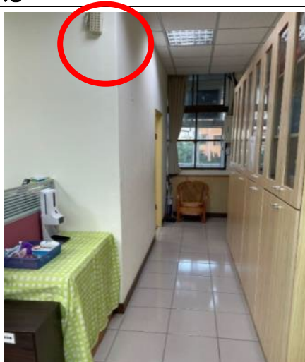
諮商空間的通道處以及各個諮商空間皆設有照明設備