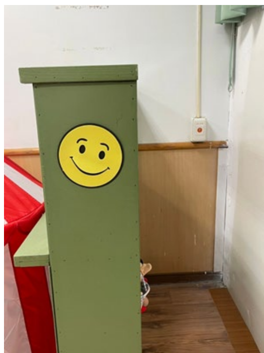
遊戲治療室： 遊戲室內備有警鈴設備，以備不時之需