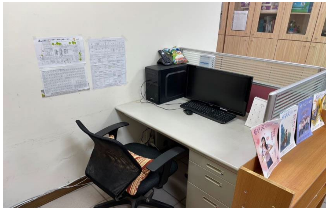
全職實習心理師備有完善的個人辦公空間，能安心進行個案紀錄的撰寫