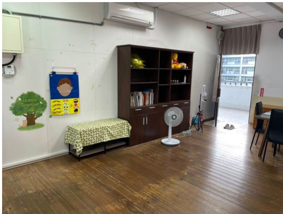
團體諮商室(由內向外)：設有情緒臉譜供團體進行時使用