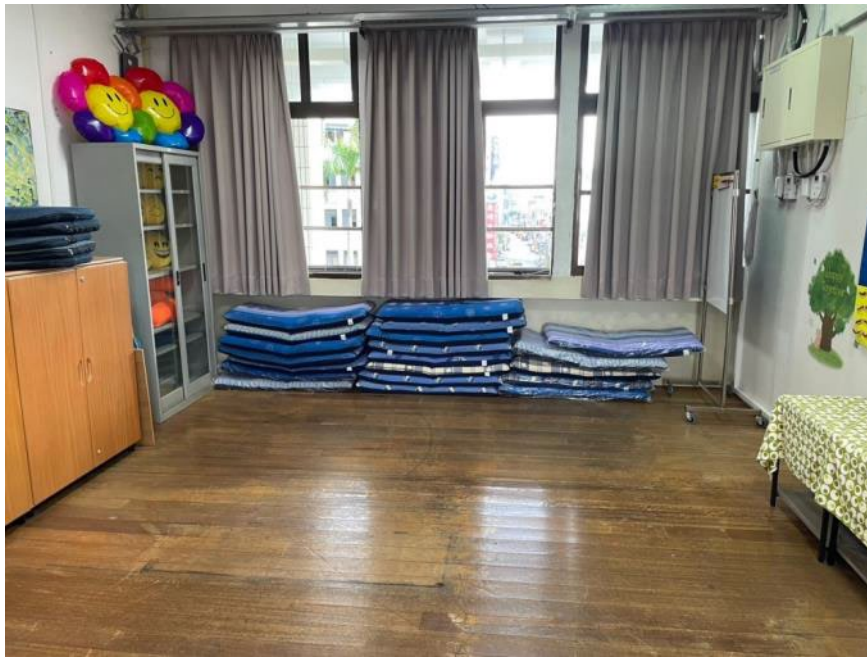
團體諮商室(由外向內)：地板空間、充足的和室椅供團體諮商使用