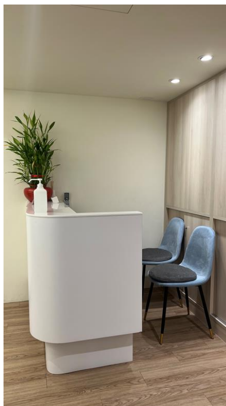
接待區 3 茶水間