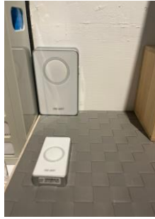
警鈴(按鈕會放於諮商室內)