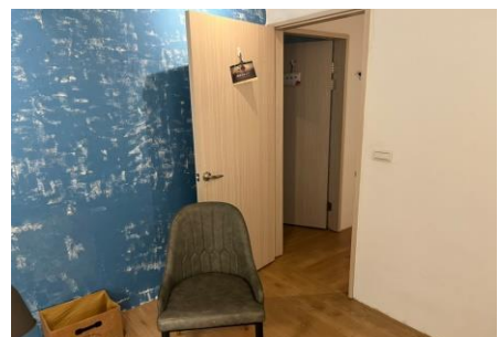
心理測驗/評估/衡鑑室由內而外