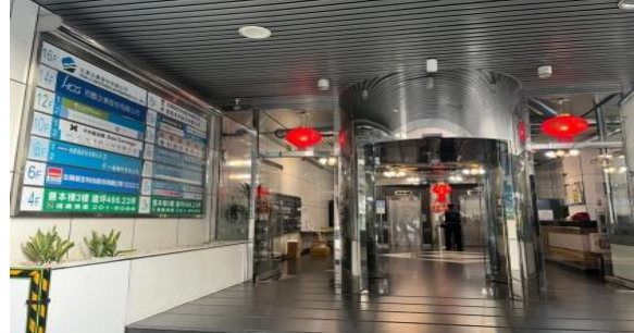
大樓一樓，電梯上五樓