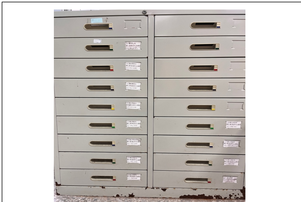
此為檔案櫃，可上鎖，存放個案紀錄、通報紀錄等相關輔導資料。