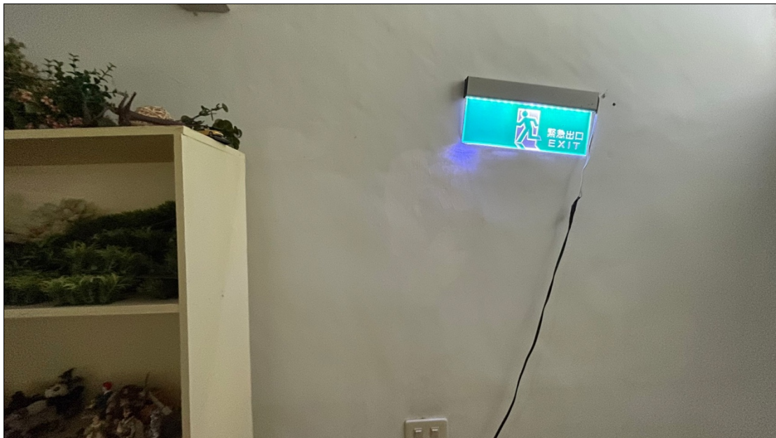
諮商室出口處設有緊急照明設備