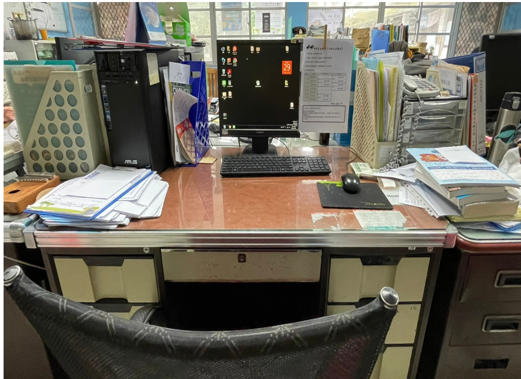
實習生有個人的座位，並提供專用電腦，以利紀錄撰寫與文書處理。