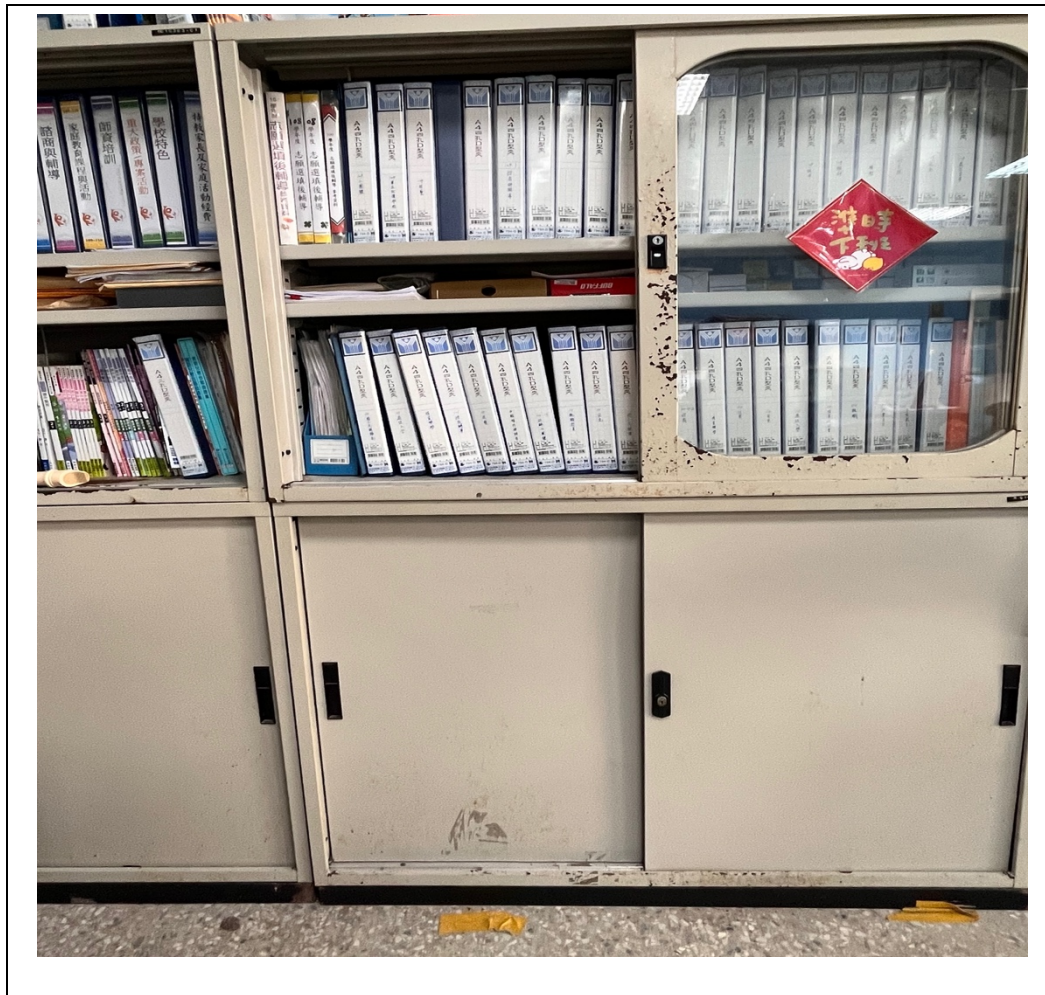
上下方鐵櫃皆可上鎖，存放測驗相關資料。