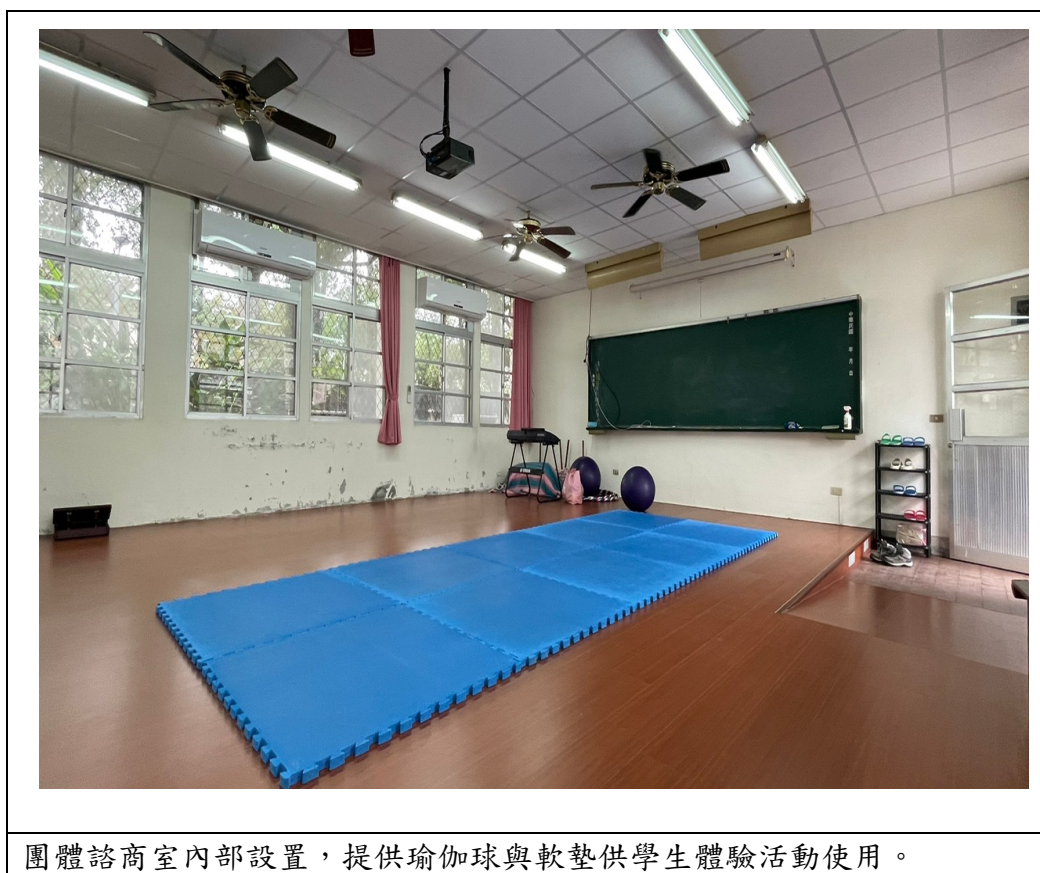
團體諮商室內部設置，提供瑜伽球與軟墊供學生體驗活動使用。