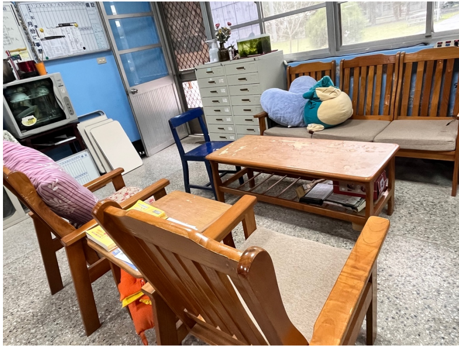
此為個案接待區，可於沙發處等候