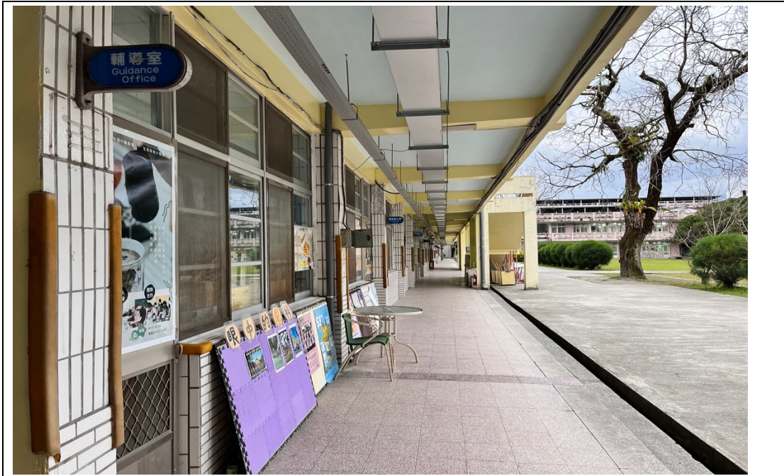
輔導室位於行政大樓一樓