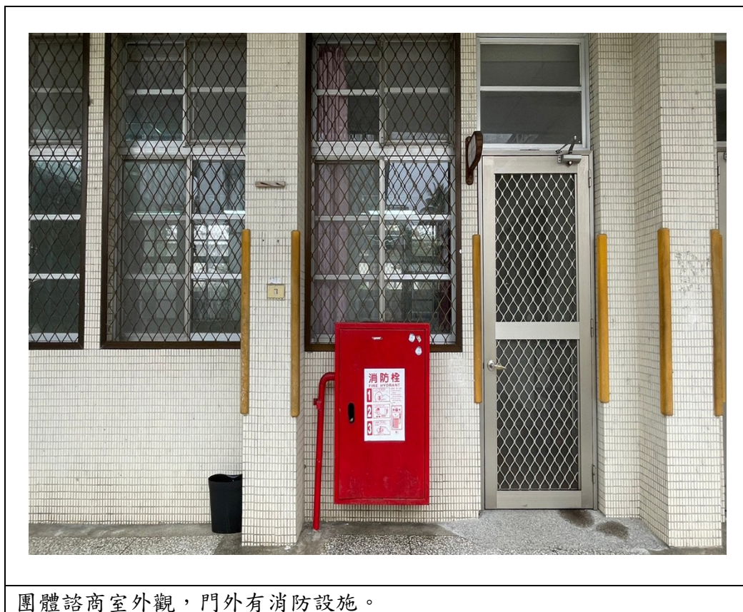
團體諮商室外觀，門外有消防設施。