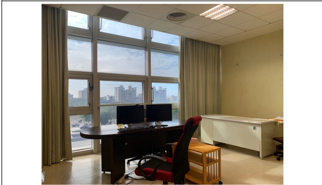
團體測驗室 (由外向內拍攝)