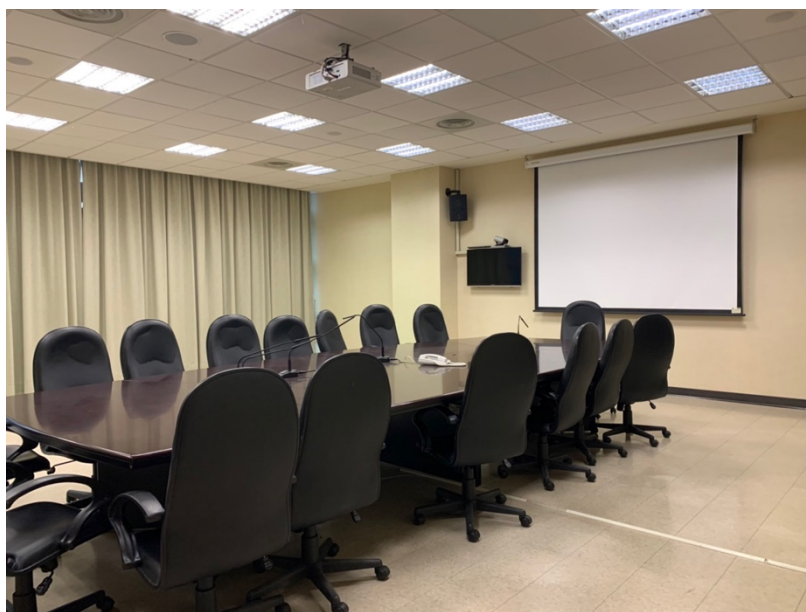
會議室（由外向內拍攝）