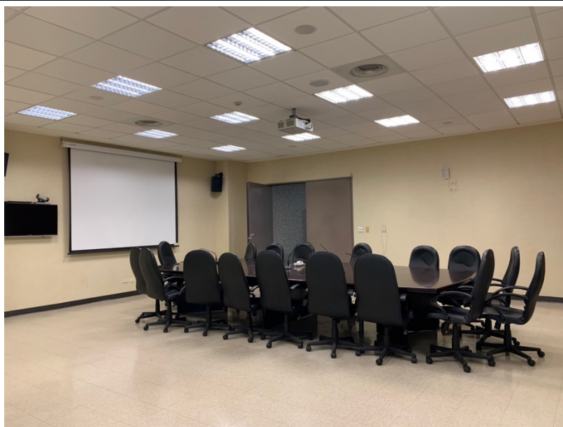
會議室（由內向外拍攝）