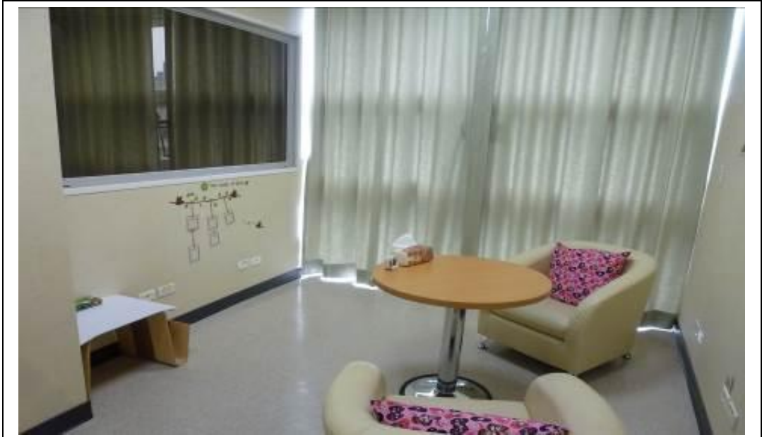
個諮室 2 空間