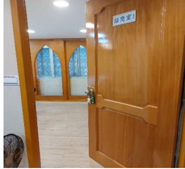
諮商室 1 內外