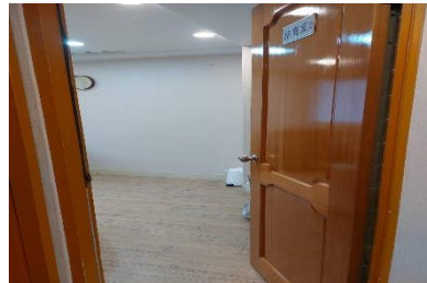
諮商室 2 內外