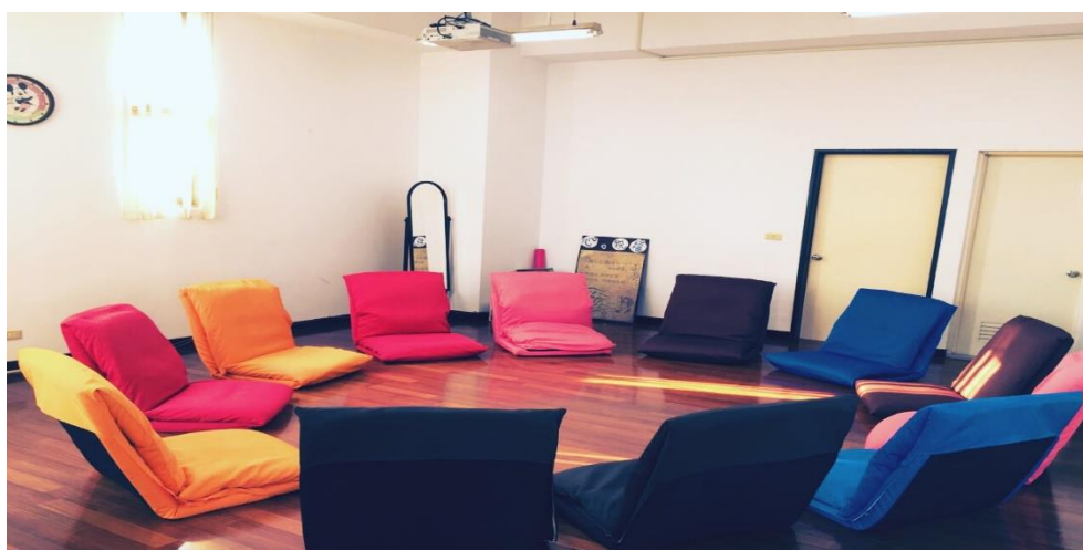
團體諮商室(共 1 間)