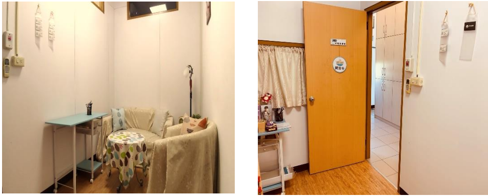
心理衡鑑室(共 1 間)-備有人際、身心適應、生涯等相關測驗工具