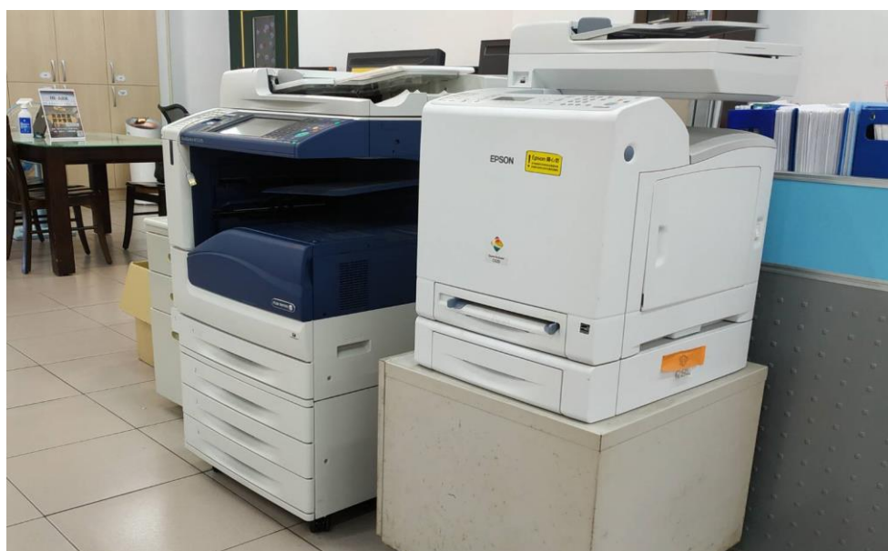
辦公室設備(影印機常備共 2 台)