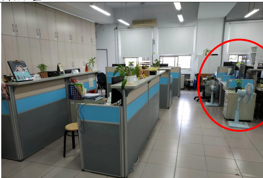
辦公區總覽(共 12 個座位)-紅圈為實習生座位區