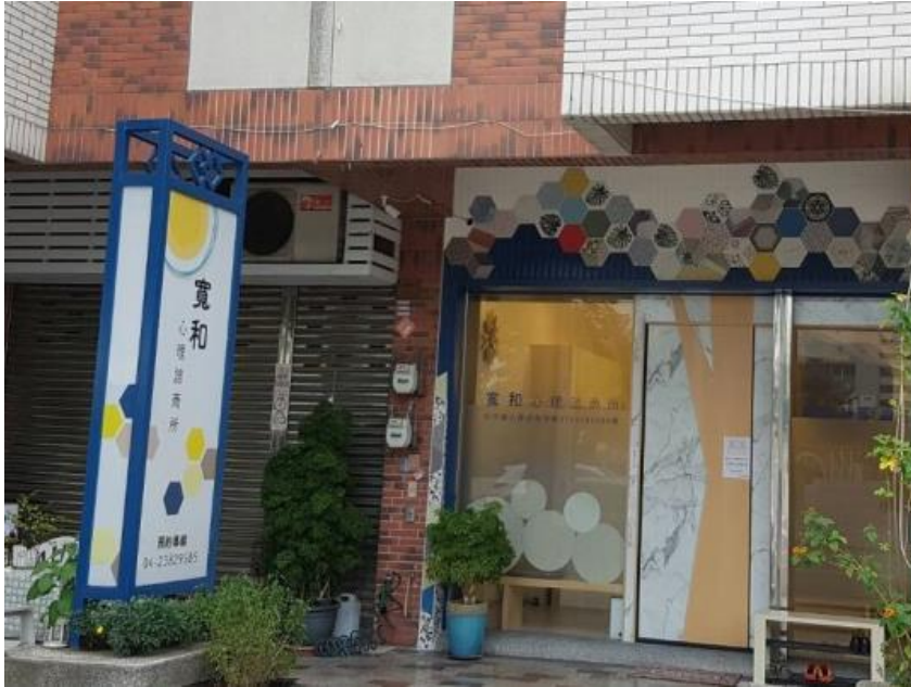
機構大門 寬和心理諮商所坐落在民宅之間。(寬和白天)