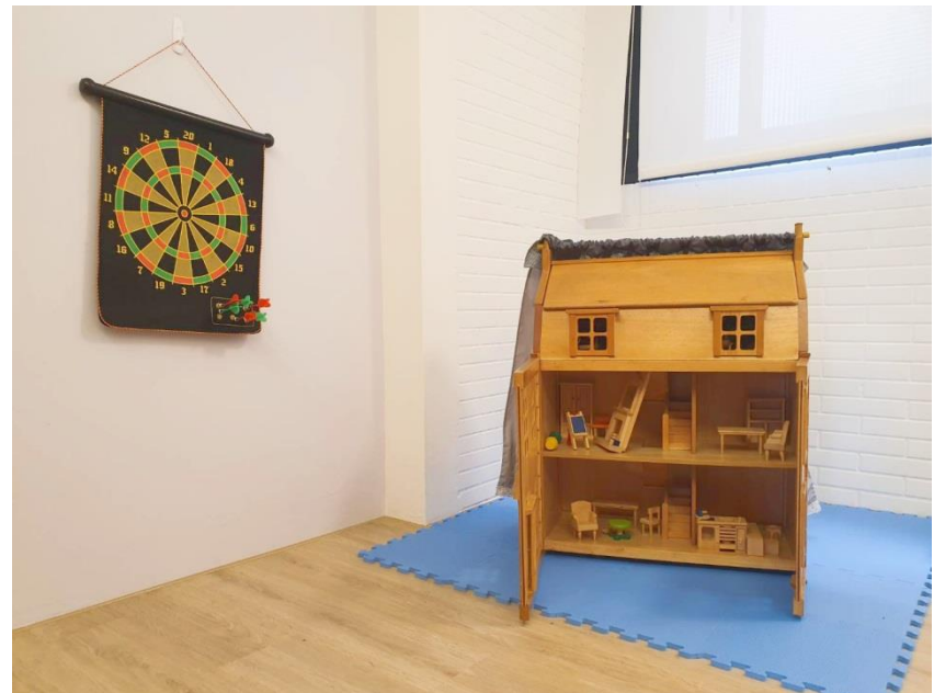
寬和心理諮商所一角