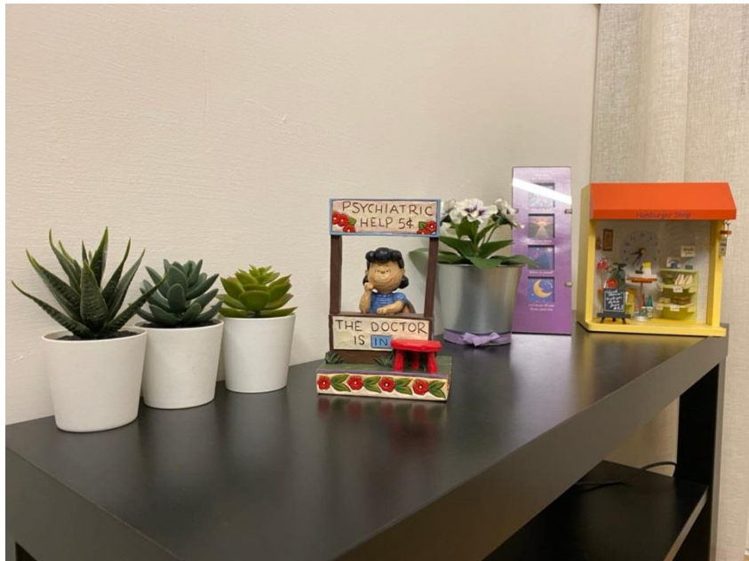
寬和心理諮商所一角