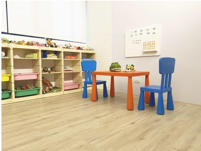
寬和心理諮商所一角