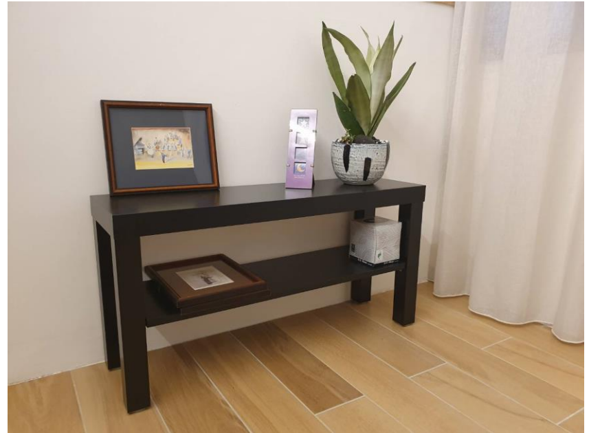
寬和心理諮商所一角