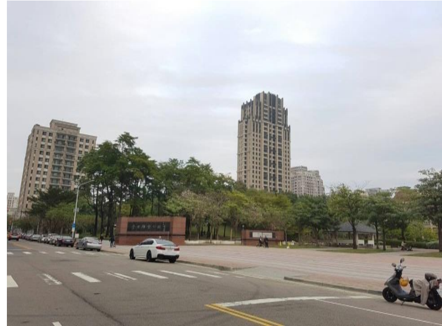
寬和心理諮商所面對為豐樂雕塑公園