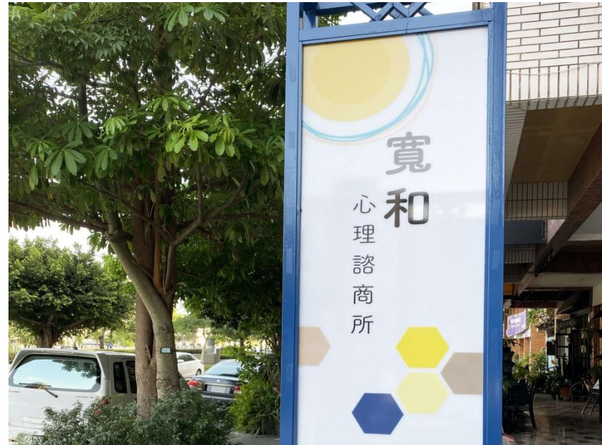
建物外觀 入夜的寬和心理諮商所招牌燈會自動開啟