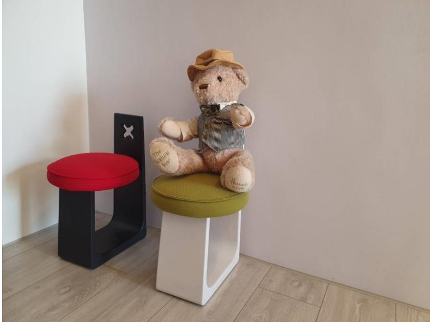
寬和心理諮商所一角