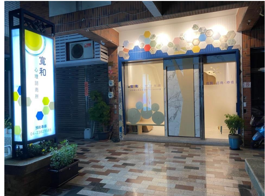
機構大門 入夜的寬和心理諮商所招牌燈會自動開啟