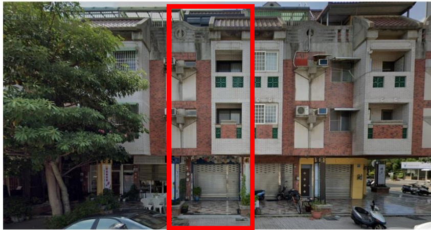
建物外觀 寬和心理諮商所坐落在民宅之間