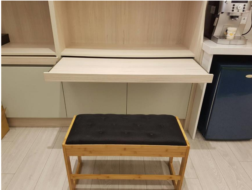
實習生辦公位置 與行政人員共用電腦與電話 可自備筆電