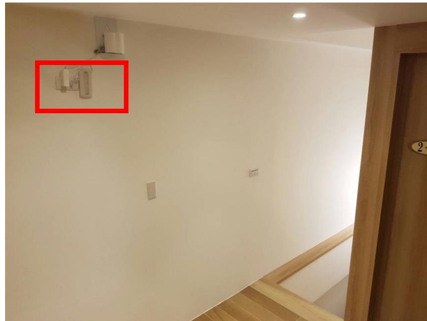
緊急照明設備設置在樓梯口