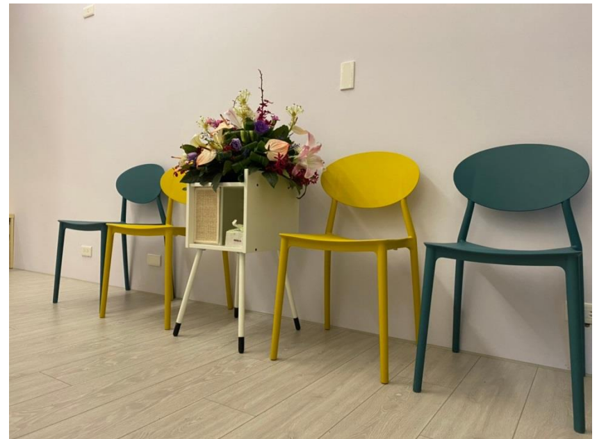
寬和心理諮商所一角