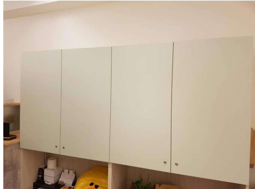
諮商紀錄檔案櫃在辦公室裡 皆有上鎖 鑰匙皆由行政秘書保管