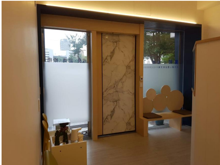
正門及一樓個案接待區